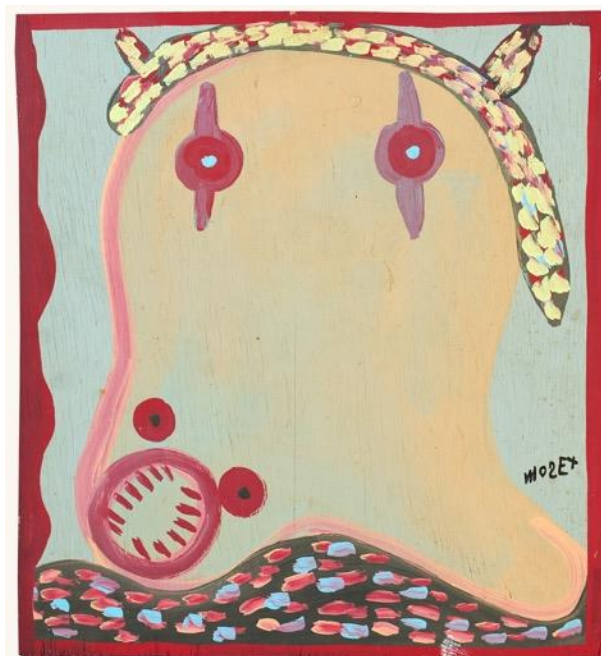
Mose Tolliver, Sans titre, Vers 1970 Peinture glycéro sur contreplaqué, 38 x 47 cm

Commissaires : Bruno Decharme, Barbara Safarova, Caroline Courrioux, Sam Stourdzé