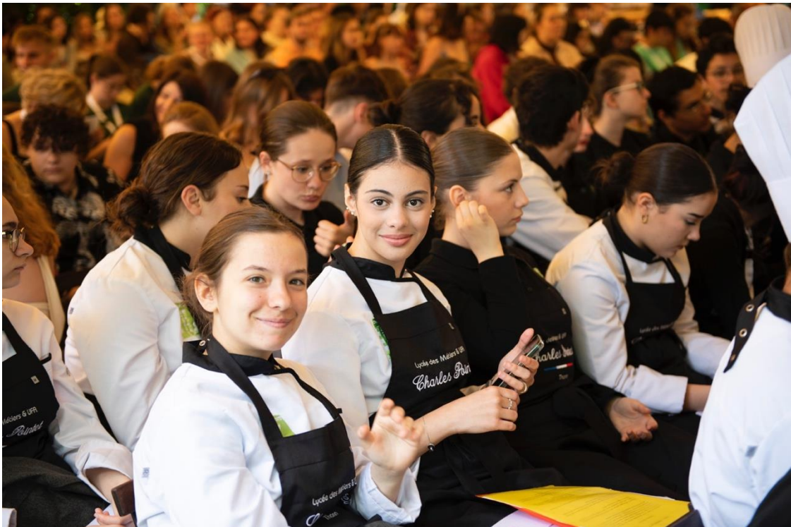
Lycéennes participantes à la Résidence Pro à la Villa Médicis en mai 2023