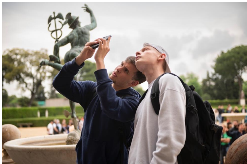
Lycéens participants à la Résidence Pro à la Villa Médicis Mai 2023

Créée en 2022 par la Villa Médicis, la Résidence Pro vise à valoriser l'excellence des filières françaises d'enseignement professionnel et agricole. Depuis sa création, le programme a bénéficié à près de 800 lycéens des régions Nouvelle-Aquitaine, Grand Est et Provence-Alpes-Côte d'Azur , partenaires indispensables de la Résidence Pro. En 2024, le programme Résidence Pro accueillera le 1000 e lycéen, et il sera du Grand Est !