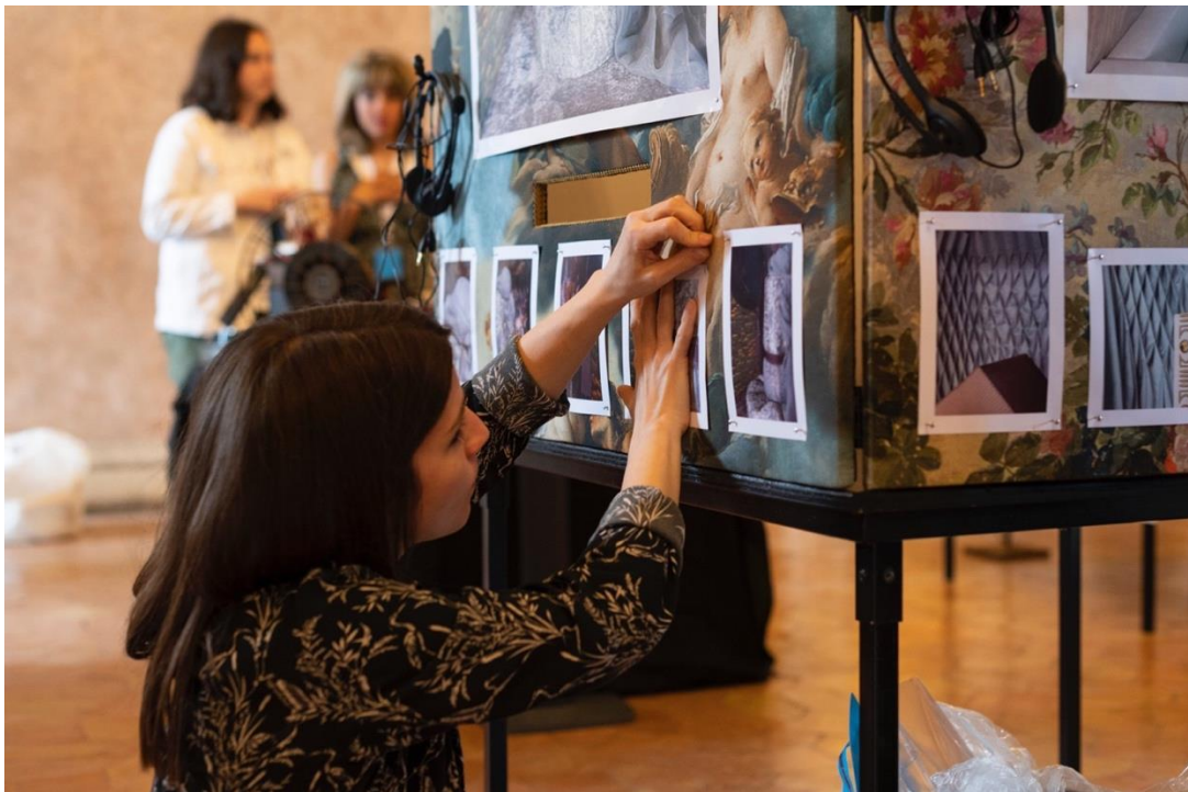
Derniers préparatifs avant la présentation des projets des lycées dans le Grand Salon de la Villa Médicis, mai 2023

Les jeunes partageront leur expérience en organisant une restitution dans leur lycée, sous la forme de leur choix : projection, dégustation, concert, atelier, etc.