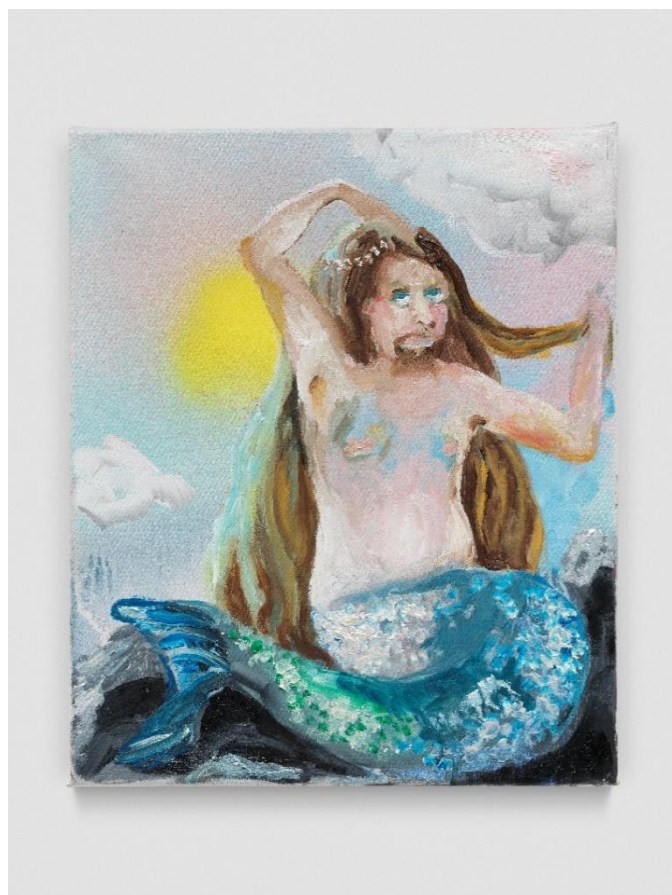
Klodin ERB, Mermaids #5 (from the series 'Mermaids'), 2023, Encre, huile, peinture acrylique en aérosol et peinture acrylique à paillettes sur toile brute, 42 x 35 cm (16 1/2 x 13 3/4 inches) Photo : Stefan Altenburger. Photography Zürich. Courtesy Bernheim et l'artiste