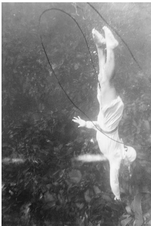
Kusukazu URAGUCHI, Sous l'eau , 1965, Photographie Avec l'aimable autorisation de l'Estate Uraguchi