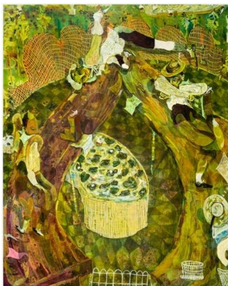
Guglielmo Castelli, Le Jardin des Refusés , 2022, olio su tela, 120 x 150 cm. Courtesy of the artist and Mendes Wood DM.

Per il prossimo incontro del ciclo Art Club , Villa Medici invita il pittore torinese Guglielmo Castelli . Ispirandosi alla letteratura, al teatro e alla storia dell'arte, Guglielmo Castelli sviluppa un universo in cui miscela figure umane e animali, frammenti di paesaggio, elementi naturali e scene quotidiane. Con uno stile figurativo in cui aree magmatiche e monocromatiche convivono con soggetti fluidi, allestisce storie in perpetuo movimento, quasi cinematografiche.