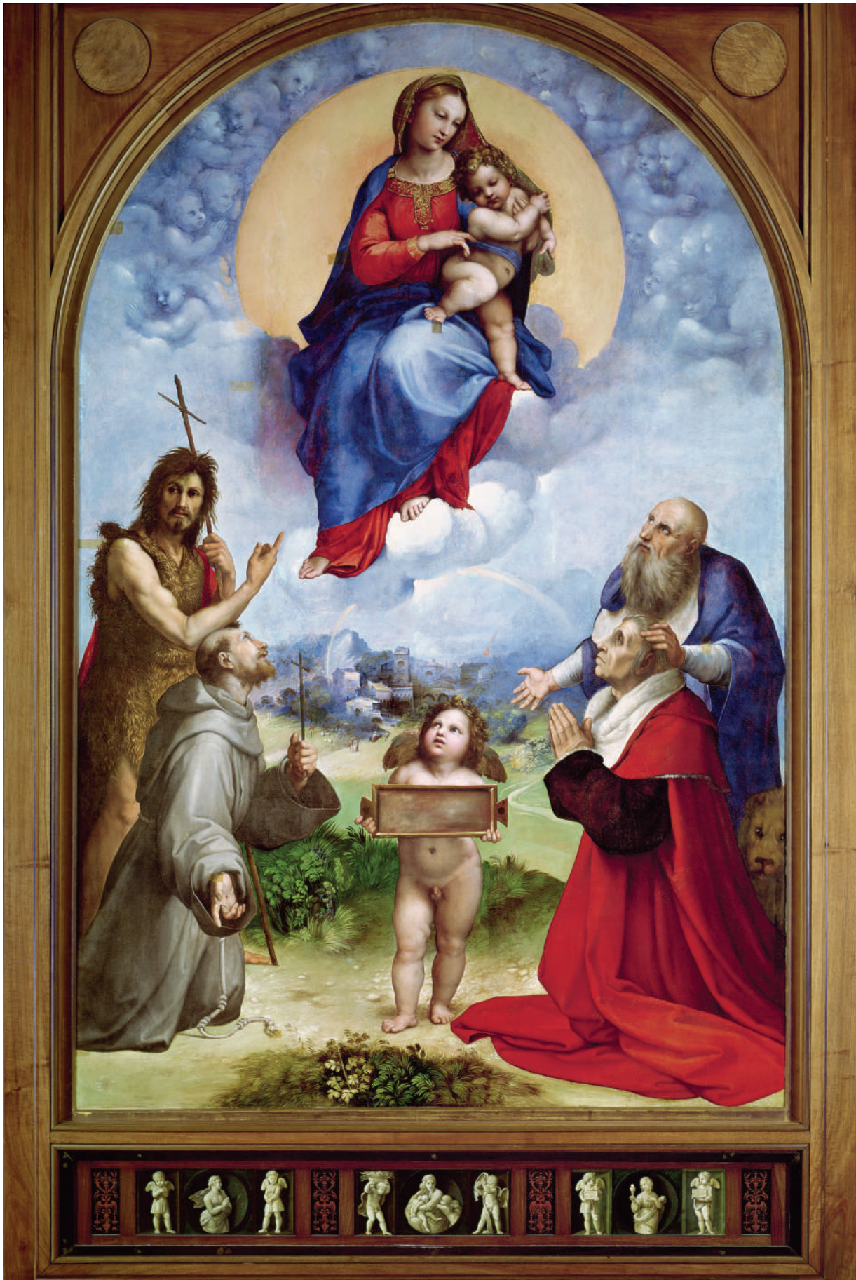
Raphaël, Vierge de Foligno , v. 1512, tempera sur bois transférée sur toile, Cité du Vatican, Pinacothèque