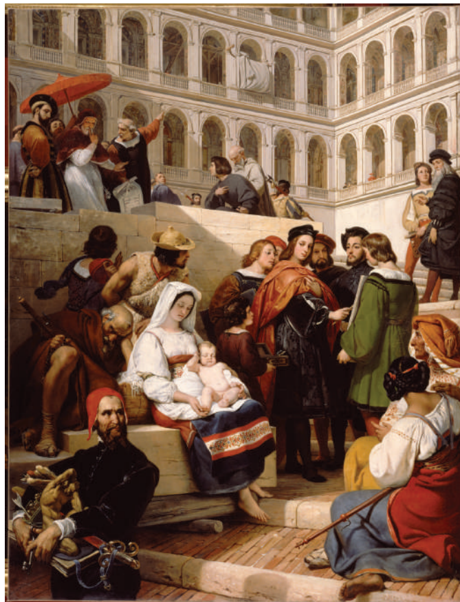
Horace Vernet, Raphaël au Vatican , Salon de 1833, Paris, musée du Louvre