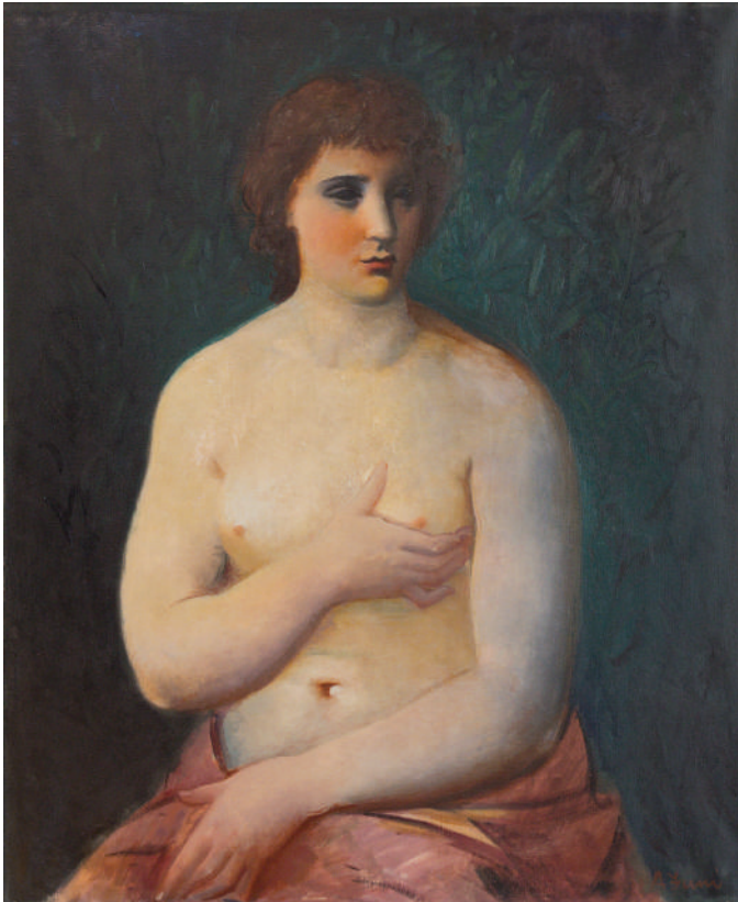
Achille Funi, Nudo femminile , c. 1930, olio su tela, 92 x 76 cm, Milano, Casa-Museo Boschi di Stefano